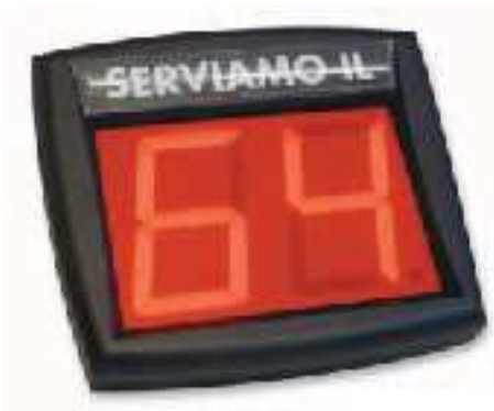
mod. My Turn

PERMETTE IL COLLEGAMENTO IN SERIE DI DUE O PIU' VISORI SENZA CAVO.